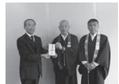
浄土真宗本願寺派山口教区防府組様