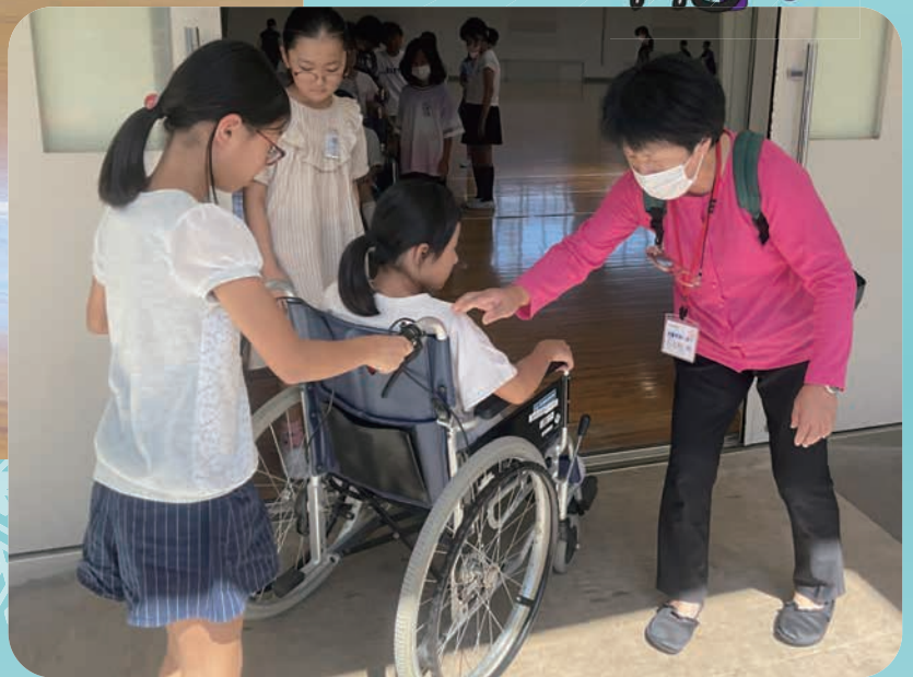
大殿サポーターさんにお手伝いいただきました。