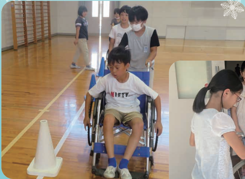
車いす体験の様子