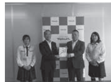
株式会社ヤクルト山陽様